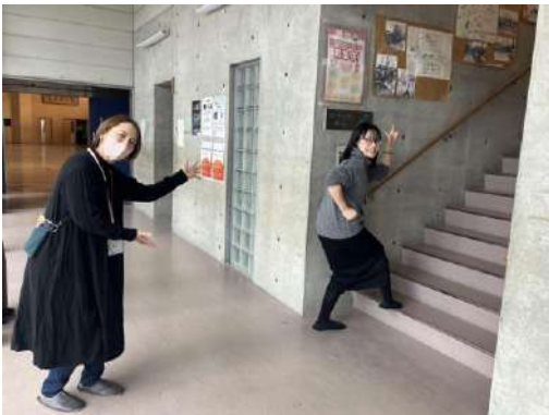
体育館横の階段を上がると・・・