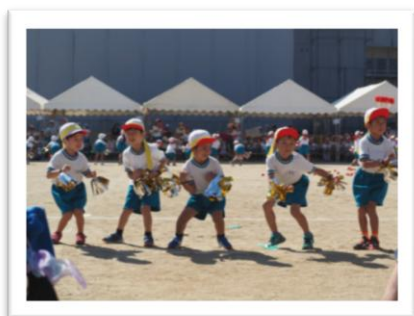
今年、大流行！ 1年生「プリンバンボン♪」

10月12日(土)天候に恵まれ、秋季運動会が行われました。 優勝は、青組『青空に羽ばたけ 群青の翼』 おめでとうございます！