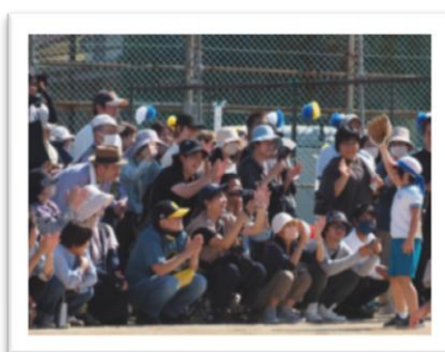
2年生の障害物競走では、大谷選手 寄贈のグローブをお披露目！！