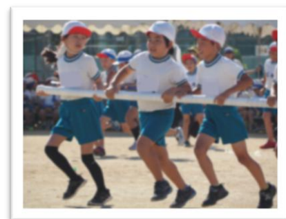
団体競技といえばコレ！と思う 保護者も多かったはず。3年生！