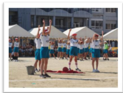
5年生の団体競技では、競技中に 過去の表現をプレイバック☆☆☆