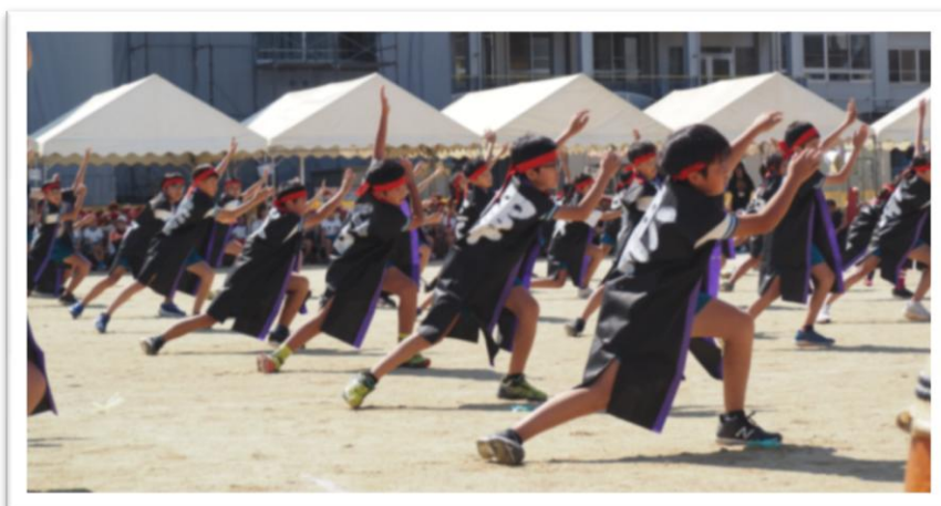
6年生の集大成！ロック☆ドリームズ！ 全力のソーラン節、かっこよかったです！