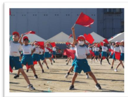
4年生は、息の合ったフラッグダンスを披露しました！